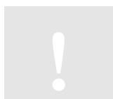
График платежей и Спецификацию необходимо вводить в том случае, если требуется контроль оплаты по договору по видам и срокам платежей. Если график платежей необходим для перенесения условий лизинга в договор передачи, достаточно ввести в графике условия лизинга.

Договор получения в лизинг можно вводить в сокращенном виде (закладка Общие данные ), или полностью ( Общие данные \ Спецификация \ График платежей ).